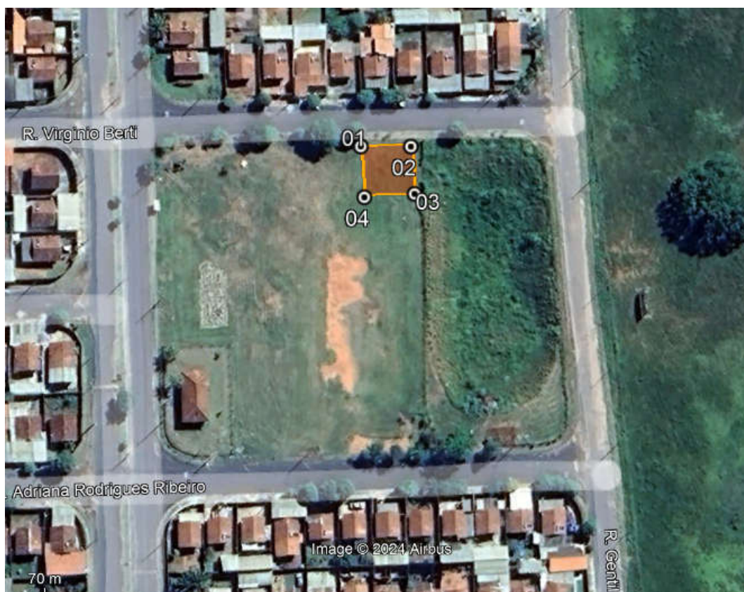
Figura 1 – Delimitação do polígono de plantio para cumprimento de TAC.